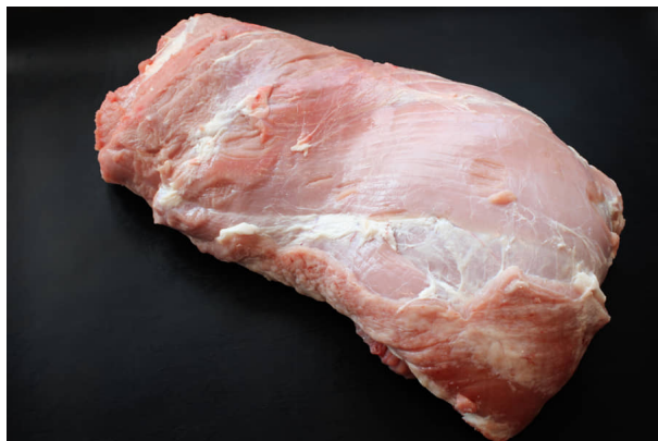
Collier de veau.jpg